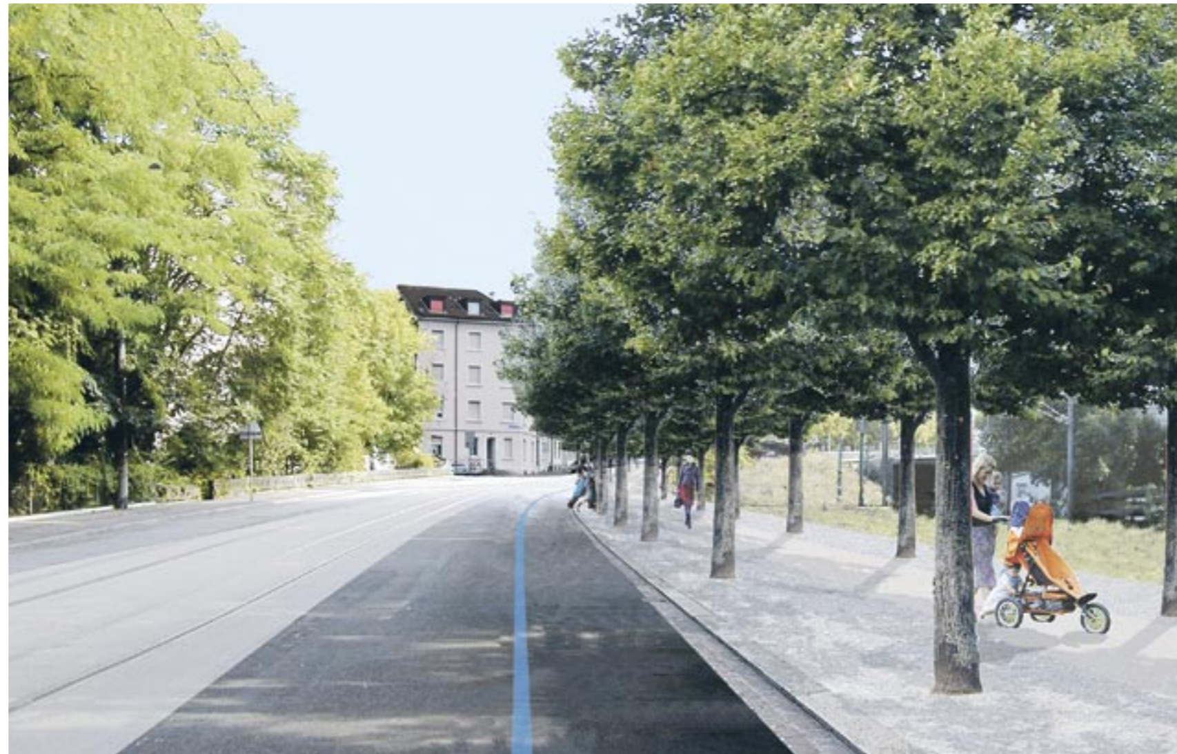
Die heutige Route der Tramlinie Nr. 1 in der Gasstrasse. Blick in die Entenweidstrasse in Richtung Kannenfeldplatz; ihre Umgestaltung konnte im Jahre 2006 abgeschlossen werden.

bis Gasstrasse gibt es neben der Tramtrasse jeweils eine Fahrbahn, eine Reihe Parkplätze sowie eine 7,5 Meter breite Promenade mit einer doppelten Baumreihe. Im Abschnitt Gasstrasse bis Vogesenplatz ist in der Entenweidstrasse eine Baumreihe vorgesehen.