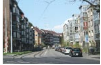
Blick in die Gasstrasse mit den Tramgleisen, wie sie noch bis in zwei Jahren aussieht. Modell der umgestalteten Gasstrasse ohne Tramgleise und wesentlich mehr Grünfläche (Zustand ab 2009/2010). Die heutige Situation in der Gasstrasse im Einmündungsbereich zur Entenweidstrasse.